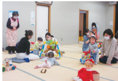
子育てひろば かるがも